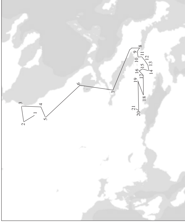
MAPA 2. Segunda ruta del Himno a Apolo .