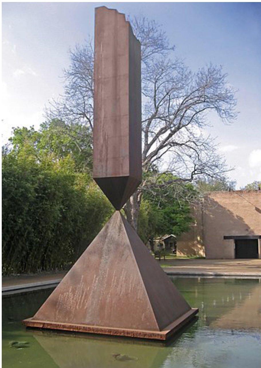
Barnet Newman, Obelisco roto . Capilla Rothko, Houston, Texas.