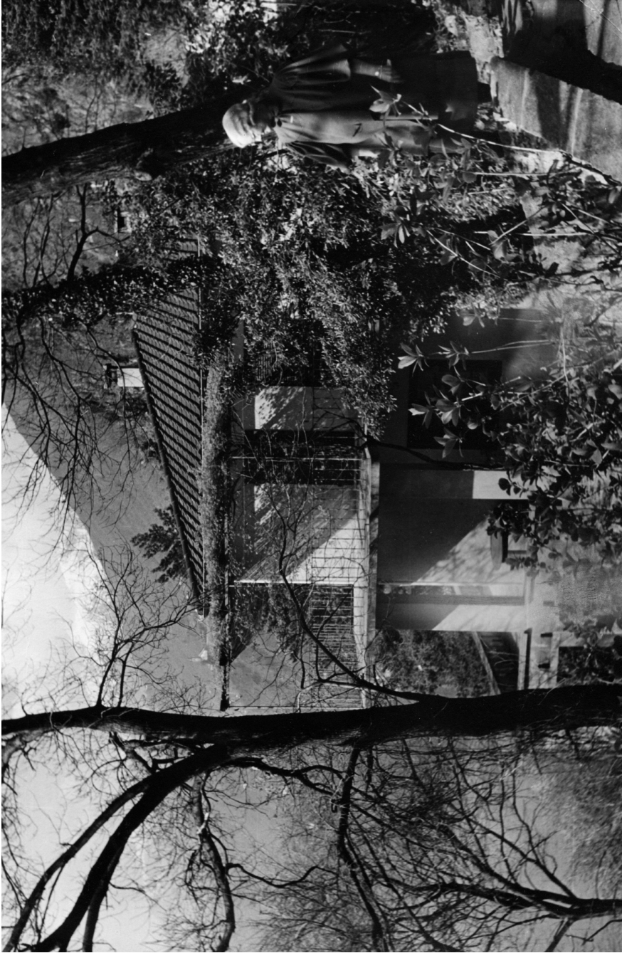
Olga Fröbe-Kapteyn al lado de la Casa Eranos en 1948.