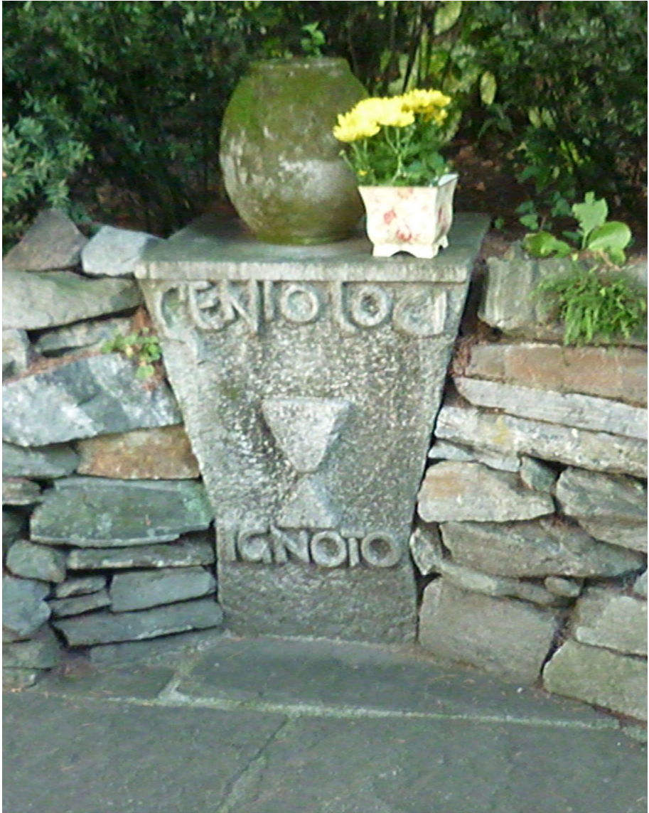
Genio Loci. Ignoto. Escultura dedicada al “genio desconocido del lugar”, en 1949, por Paul Speck (1896–1966) y colocada en la terraza de la Casa Gabriella.