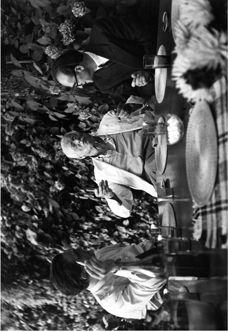
Erich Neumann, C. G. Jung y Mircea Eliade alrededor de la Mesa redonda en agosto de 1950.