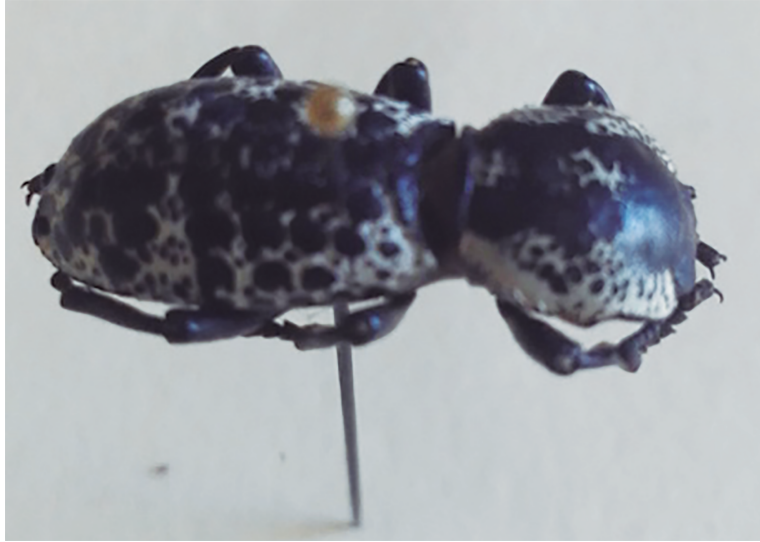
Figura 8. Tsurum pat chan/way way chan .

Por último, están los llamados gorgojos chinos. Los pobladores no los reconocen como insectos locales, ya que se han conseguido a través de familiares en San Cristóbal y Ocosingo. Se dice que provienen de China, de ahí su nombre, y llegaron a Oxchuc aproximadamente hace un año; se usan para males como el cáncer y la diabetes (aunque se les considera una panacea para varias afecciones). Se crían en cautiverio en contenedores de plástico (loncheras y vasijas) y de cristal (frascos reutilizados); se les alimenta con pan integral. La dosis consiste en comer los gorgojos vivos todos los días; uno el primer día e ir aumentando exponencialmente hasta llegar a 70 y después hacer la cuenta regresiva (69, 68... 1). Estos gorgojos chinos se pasan entre familiares y amigos, por lo que su consumo está en aumento en Oxchuc.