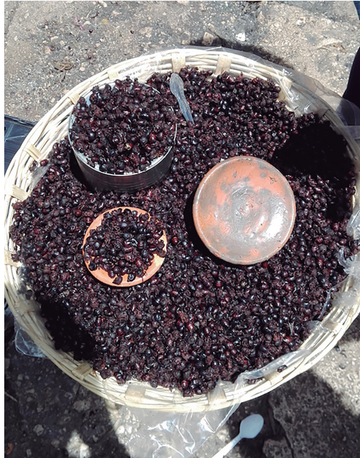
Figura 1. Ts'isim de venta en el mercado local.

buscando una fuente de luz. Por ello las colectas se realizan cerca de fuentes de iluminación artificial, en espacios semiabiertos (cancha deportiva y calles). La colecta la hacen principalmente niños, niñas y mujeres cuando comienza a oscurecer, alrededor de las 5:00 pm, y finaliza a las 7:00 pm aproximadamente (según la perseverancia de los colectores o cuando ya es hora de ir a descansar); de igual forma se realiza por las madrugadas, de 5:00 am a 6:00 am. Los horarios de colecta hacen que los pobladores afirmen que a los ts'isim no les gusta la luz del sol.