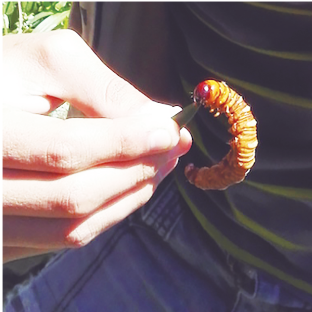
Figura 2. Chanulte' .

y mariposa ( pejpen , nombre genérico). La temporada de colecta es de ocho meses (aunque también afirman que es todo el año). El chanulte' se encuentra en árboles como el munuste' o sak munuste' y chikinib . Éste hace un orificio barrenado hacia abajo en el fuste del árbol, mismo que está cubierto con una especie de tela con aserrín que la larva elabora. Se pueden encontrar de una a tres larvas por árbol. La colecta la hacen niños y rara vez hombres o mujeres, quienes buscan “el panalito de tela”, que cubre el orificio elaborado por el chanulte' , dentro del cual se vierte agua y se espera de uno a tres minutos. El colector debe estar alerta, ya que el insecto provoca burbujas antes de salir a “respirar”; al asomarse la larva se le punza con una espina o aguja obligándola a salir y se deposita en botes o morrales. Una vez colectados suficientes (de 10 a 20), se llevan al hogar procurando llegar a la hora en que las amas de casa están preparando la comida; ellas lo dorarán en comal o en sartén con un poco de aceite vegetal para realzar el sabor. Este se come en taco como tentempié antes de la comida principal.