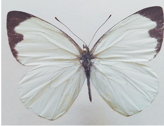
Figura 15. Sakil pejpenetik .

Unos insectos muy apreciados para juegos infantiles son el grillo ( chilil ) y dos especies de chapulines ( xk'ajk' y bilich ). Al primero se le encuentra dentro de la casa o en el bosque. La diversión consiste en atrapar y dejar ir a los insectos, para ello se necesitan varios niños, y quien los atrape más veces es el “chingón” (el mejor) y el ganador. Respecto al xk'ajk' y el bilich , éstos son chapulines con que los niños juegan. Ambos son capturados en el campo o durante el trabajo en la milpa. El hecho de atraparlos es lo divertido; sin embargo, ocasionalmente se les despoja de las alas para que no puedan volar y sea más fácil su captura. De la misma manera se les amarra con un hilo para hacerlos volar y brincar. Cuando el niño ya se ha aburrido es común que golpee al chapulín contra una pared, un árbol e incluso sobre el suelo hasta que quede decapitado. Se menciona que en el caso del x-k'ajk' se le arranca las patas traseras para retirarle el exoesqueleto y dejar libre el “tendón” principal. La finalidad es que jalando este tendón se provoca que el resto de la pata se retraiga, lo que causa risas entre los niños. Esta acción se realiza con todos los x-k'ajk' que se encuentran.