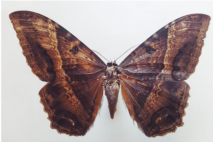
Figura 9. Ijk'al pejpen .

se cumplirá. Sin embargo, para la segunda opción la población es temerosa, ya que eso enojaría al portador del nahual y desencadenaría una venganza por el atrevimiento.