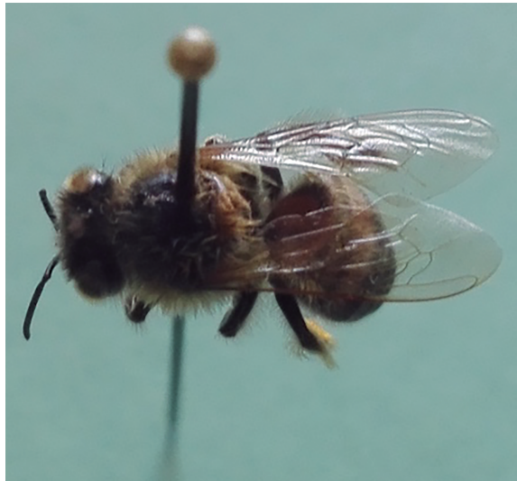
Figura 5. Chab' .

Se le conoce como chab' (Figura 5) a una abeja que hace su panal entre rocas que se encuentran a una altura de 10 a 15 metros aproximadamente. Los pobladores suelen buscar en los terrenos familiares a las abejas que vuelan alrededor del panal. Ya localizadas se buscan ramas secas para colocarlas bajo el panal o bien se lanzan ocotes prendidos dentro del mismo; ambas técnicas se hacen con la intención de que el humo espante a las abejas. La colecta la hacen entre dos o más personas (hombres y niños de más de 11 años), y la miel se pone en vasijas y se reparte a la familia; se consume usando la tortilla como cuchara, la cual se embarra de la miel obtenida y se degusta.