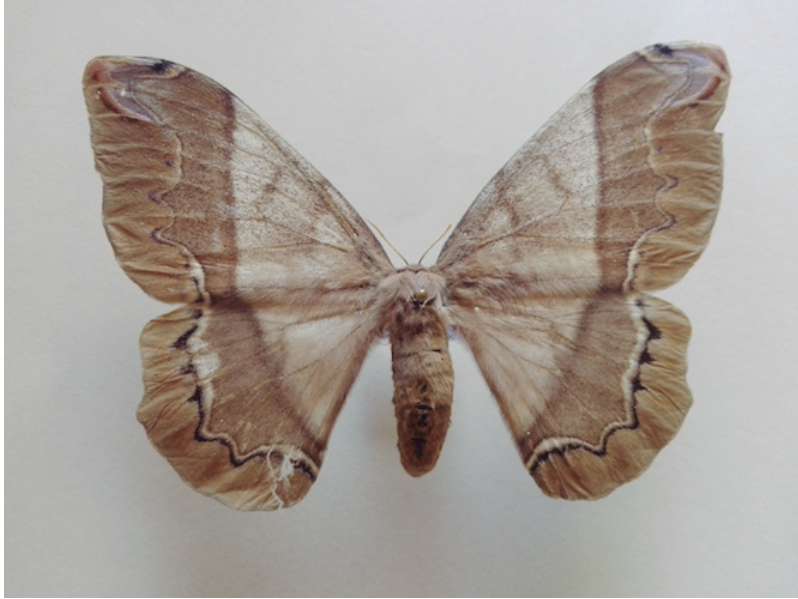
Figura 3. Sats' en etapa adulta.

Por otro lado, existen dos escarabajos, el x-chial (Figura 4) y el kujt'intsa . El primero es el que se consume y se caracteriza por tener “cuernos” que pueden lastimar durante su captura. Es necesario distinguirlo del kujt'intsa , Phyllophaga rugifemis (Schauffus, 1958), el cual “nace” del estiércol, por lo que no es apetecible. Un indicador de que ya es o se acerca la temporada del x-chial es el florecimiento de la espiga del maíz, alimento del insecto, lo que asegura que se podrá encontrar. De hecho, se considera que la aparición de la espiga (junio) y el elote (agosto) en la milpa coinciden con la transformación de k'olom (gallina ciega) a x-chial (escarabajo), por lo que se prefieren estas fechas para su consumo, ya que “están frescos”. Se colectan en la milpa o el traspatio y se pueden hallar de uno a nueve insectos. Se doran en comal, se les retiran las patas y el exoesqueleto, se ponen en tortilla a manera de taco y se les añade sal.