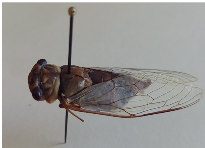
Figura 10. Chixkirin/Xikitin.

familiares allegados. El mensaje se interpreta como “una gran alegría para la familia”, por lo que se tendrán que preparar los alimentos necesarios para procurar la comodidad de los visitantes. Asimismo, existen predictores de clima. Uno de ellos es la “chicharra”. Aunque no existen en la cabecera municipal de Oxchuc, los pobladores que tienen terreno en zonas cafetaleras identifican su sonido con la época de sequía, y cuando la escuchan “cantar” procuran no sembrar plantas de importancia, o de lo contrario se secarán por la falta del vital líquido. De igual manera, el canto del grillo está asociado a la sequía y al calor en la localidad, de ahí que los pobladores tomen en cuenta la información para planear sus actividades.