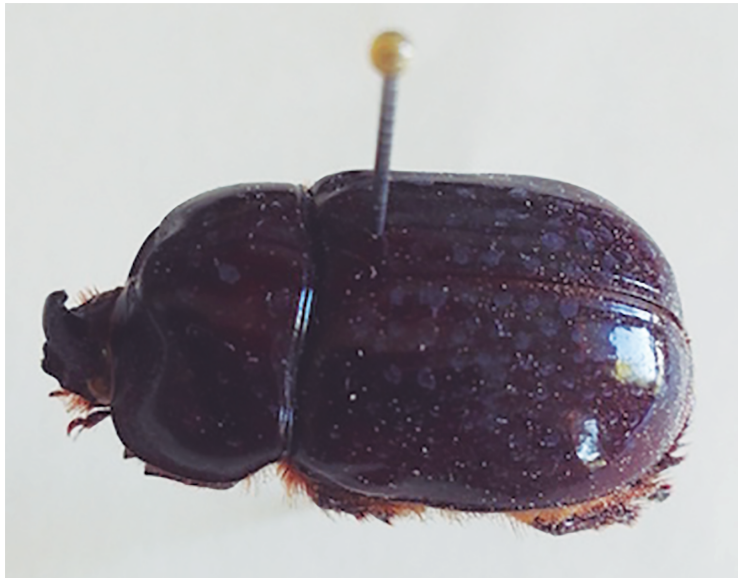
Figura 4. X-chial .

En la localidad existen dos especies de chapulines comestibles: el x-k'ajk' y el bilich' . El primero es de tonalidad café y se encuentra en la milpa; el segundo es de color verde y se halla en acahuales de no más de un año y en campos donde hay mucho zacate. La temporada de ambos insectos coincide con la tapisca del maíz, y son los niños quienes se encargan de la colecta durante los ratos de ocio. Los niños persiguen a los chapulines, con ayuda de una rama o ropa vieja con la que golpean para poder capturarlos. Una vez agarrados les quitan las alas, las patas y los depositan en un morral para transportarlos. En casa se doran en comal, después se colocan sobre una tortilla, se les agrega sal y se comen en tacos.