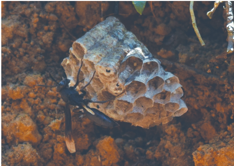
Figura 11. Nido de Xuxk'ajk' .

También encontramos a los piojos, liendres, pulgas y garrapatas, que se consideran chupadores de sangre. A los piojos se les conoce como uch' , a las liendres como osjol , a las pulgas como ch'ak y a las garrapatas se les denomina sip . Los primeros dos suelen estar como parásitos en la “cabeza” de los humanos, y se les controla de manera manual o con peines especiales que se compran en las tiendas; en ocasiones la madre o la abuela buscan en la cabeza de sus nietos y al encontrarlos los aplastan entre las uñas o bien se colocan entre los dientes para matarlos. Respecto al ch'ak y el sip , se encuentran principalmente en animales y ocasionalmente en personas, y su control es manual.