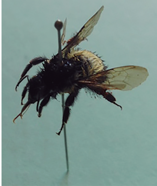
Figura 6. Jonon .

También encontramos al tuluk' chan , considerado “pariente” de los escarabajos x-umaj y x-chial . Es de color negro y ayuda a desaparecer verrugas del cuerpo. Aparece de manera fortuita durante la búsqueda de leña, al ir a la parcela o cuando se camina por las veredas; generalmente se les ve entre o bajo las piedras. Del insecto, se usa una secreción color anaranjado que se coloca sobre el mezquino que se desea desaparecer (para mejores resultados hay quienes lastiman la parte afectada); se libera al animal procurando no hacerle daño. Los pobladores aseguran que la curación no duele, pese a que la parte tratada luce como piel quemada.