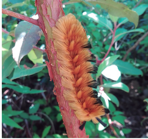
Figura 12. Chup .