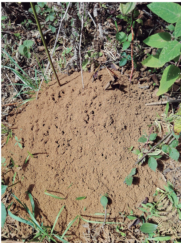
Figura 7. Nido de xanich .

Existe la idea de que las hormigas que pican pueden curar “la pereza de la mano” y hacer que ésta trabaje más rápido. Por ejemplo, en mujeres para que las mujeres torteen rápidamente y bien, y para que los hombres, al trabajar con azadón, machete o coa, avancen con rapidez durante la jornada laboral. Para ello, la persona sale a buscar un nido a orillas del camino y, una vez localizado, mete ambas manos y las deja el tiempo suficiente para que las hormigas piquen. Aunque se siente dolor es una práctica común entre niños y jóvenes (Figura 7).