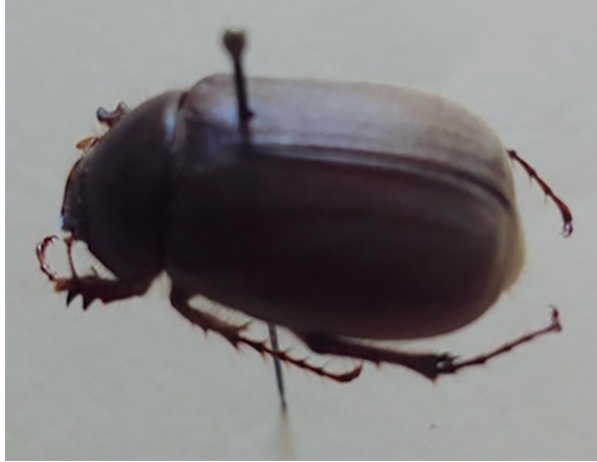
Figura 13. X-umaj .