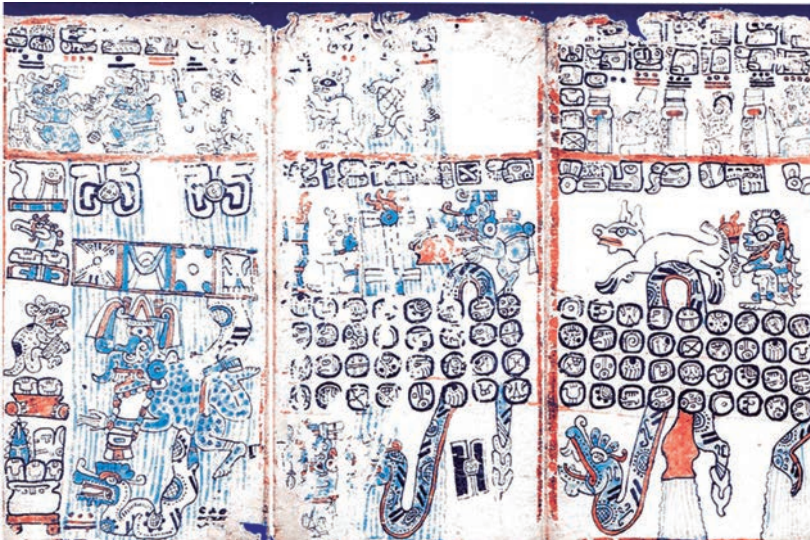
FIGURA 1. Códice Madrid , 12b-15b (apud Milbrath, 1999).

En un almanaque agrícola del Códice Borgia , documento del Posclásico Tardío procedente del Centro de México, que exhibe paralelos con el Códice Madrid (Aveni, 1999; Bricker 2010; Vail y Aveni, 2004; Hernández y Vail, 2010), se aprecian vínculos entre Venus y los eclipses (Milbrath, 2013). Una imagen en la tabla de eclipses del Códice Dresden (58b) muestra claramente la importancia de Venus en el contexto de los ciclos de eclipses también en el área maya (Milbrath, 1999: 162). Lo más probable es que el Códice Madrid se feche a mediados del siglo xv, en el Posclásico Tardío, al igual que el Códice Borgia (Vail y Aveni, ibid. : 12). El almanaque de 260 días, con imágenes de eclipses en el Códice Madrid , 12b-18b (figuras 1 y 2), ha sido comparado con uno que aparece al principio del Códice Borgia , el cual muestra el calendario completo de 260 días (Bricker y Bricker, 2015: 172; Just, 2004). El calendario de 260 días está organizado en cinco filas de 52 días en el Borgia , mientras que en el Madrid tiene una disposición en cuatro filas de 65 días, y las últimas trecenas en cada fila están ausentes, ya sea porque el espacio era insuficiente, ya porque la trecena faltante pudiera encontrarse en la página 12b, que precede al Tzolkin.