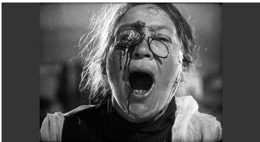
Serguei Eisenstein, El acorazado Potemkin (1925).

Eisenstein reaparece en Le fond de l'air est rouge , de Chris Marker, una película filmada en 1977, abreviada y revisada en 1993, al momento de su segundo lanzamiento, y de nuevo en 2003, cuando se puso a disposición del público de habla inglesa como A Grin Without a Cat .