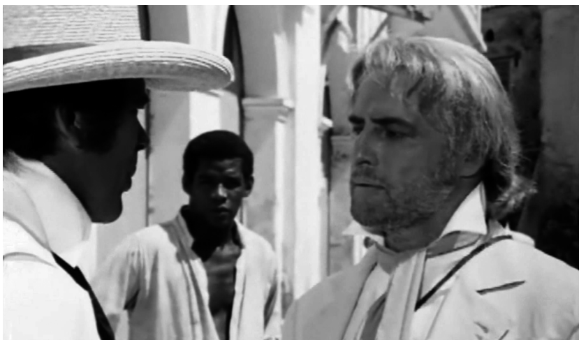
Gillo Pontecorvo, Queimada! (1969), Produzioni Europee Associate.

década turbulenta. La película se rodó en Colombia, diez años después de la Revolución cubana y dos años después de la muerte del Che Guevara en Bolivia. Pontecorvo ya había alcanzado fama internacional gracias a La batalla de Argel (que ganó el León de Oro en el Festival de Venecia en 1966) y su nueva cinta claramente hacía eco de la Guerra de Vietnam cuando recién se había registrado la victoriosa Ofensiva del Tet de las fuerzas de la guerrilla, por lo que recibió un fuerte apoyo del movimiento antibélico estadounidense. En Europa, Francia se había visto sacudida por la revuelta de mayo de 1968, Irlanda del Norte parecía explotar, e Italia estaba por experimentar la oleada más poderosa de huelgas después de la Segunda Guerra Mundial (el otoño caliente ). En tal contexto, la representación de una derrota revolucionaria no podía aparecer más que como un recordatorio del largo, épico y difícil camino hacia una victoria inminente. Desde sus primeras imágenes, acompañadas por la música de Ennio Morricone, Queimada! corre como una incitación al combate.