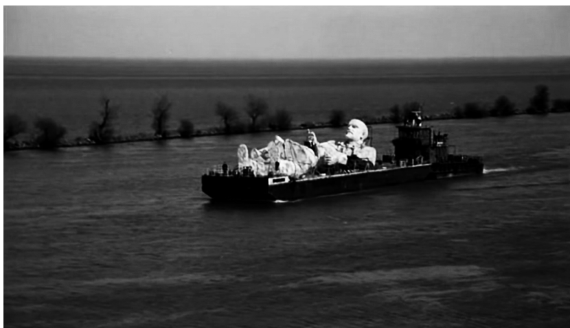
Theo Angelopoulos, Le Regard d'Ulysse (1995), Paradis Films, La Sept, Centre du Cinéma Grec.

La concepción del cine de Eisenstein, por ejemplo, es emblemática de una visión estratégica del pasado como reservorio de experiencias cuya selección permite construir tanto una forma estética de la historia como un mensaje político. Sus películas de la década de 1920 ilustran la historia rusa como un camino que se despliega hacia la revolución. El símbolo de esta ruptura con el pasado y de esta proyección utópica hacia el futuro en Octubre [ Oktyabr ] (1927) es la escena de la caída de la estatua zarista en medio de la multitud insurgente. En La mirada de Ulises [ Ulysses' Gaze ] (1995), de Theo Angelopoulos, lo que vemos es una estatua rota de Lenin, epítome del comunismo en sí.