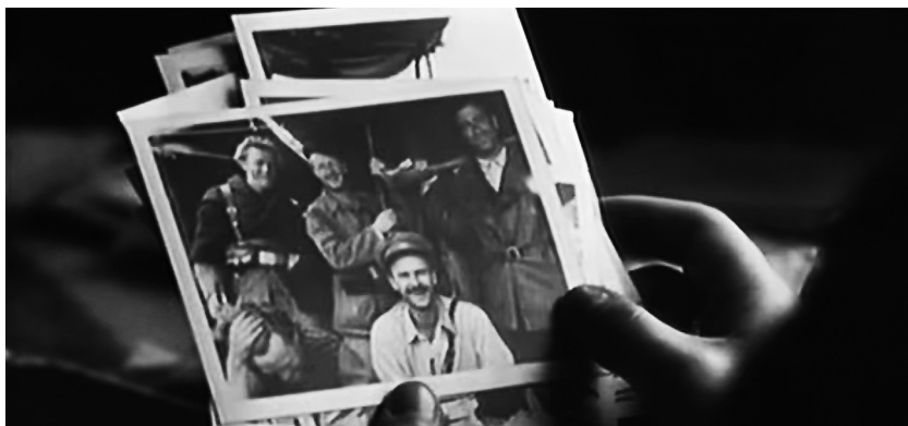
Ken Loach, Land and Freedom (1995), PolyGram.

Tierra y libertad [Land and Freedom] , de Ken Loach, se estrenó al mismo tiempo que Ulysses' Gaze , y ambas fueron premiadas en el Festival de Cine de Cannes. En esta película, es la revolución misma la que se convierte en un lugar de la memoria, evocado y “revivido” empáticamente con una nostalgia conmovedora. Pero la mirada melancólica de Loach es, antes bien, el reverso de la resignación. Más allá de hacer un homenaje a la Revolución española, su película quería sacudir el Zeitgeist conformista de la década de 1990, así como refutar la representación convencional de la Guerra Civil española como una suerte de catástrofe humanitaria. Desde este punto de vista, Tierra y libertad 17 aparece casi en las antípodas de Soldados de Salamina , la aclamada novela de Javier Cercas en la que la dimensión trágica de la Guerra Civil española no deja ningún lugar para la esperanza o para las razones de un compromiso político.