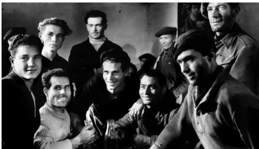
Luchino Visconti, La terra trema (1948).

do en una fuerza poderosa, pero completamente aislada, mientras que los movimientos sociales habían sido derrotados en todas partes. En abril de 1948, la Democracia Cristiana, la nueva fuerza dominante del conservadurismo, ganó las elecciones políticas y, tres meses más tarde, un intento de asesinato perpetrado en Roma contra Palmiro Togliatti, el líder comunista, provocó una ola de insurrecciones en todo el país que —controlada con presteza por el Partido Comunista— cerró simbólicamente la efervescencia política de los años de posguerra. Al mismo tiempo, una coalición de la Democracia Cristiana, la mafia y el latifundio prevaleció en el sur. Un momento emblemático de esta restauración social y política fue la masacre de Portella della Ginestra, en mayo de 1947, en la que una pandilla de bandidos instigados por terratenientes asesinó a 11 campesinos e hirió a 27, de los cuales siete murieron en los días posteriores. Las luchas por destruir el feudalismo e instaurar relaciones sociales igualitarias en la Italia rural habían sido destrozadas. Según Paul Ginsborg, esta derrota cobró “dimensiones históricas, puesto que determinó los valores de la vida contemporánea del sur” (139).