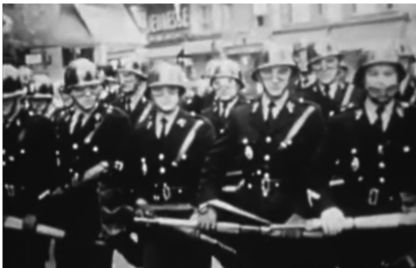
Chris Marker, Le fond de l'air est rouge / A Grin Without a Cat (1977, 1996), First Run / Icarus Films.

experiencias diferentes y sus empatías son variables, pese a su decisión de no asumir una postura ideológica. Por ejemplo, no critica a Fidel Castro, pero reconoce su propio pasmo ante la aprobación de la invasión soviética a Checoslovaquia por parte de Castro en 1968, en apariencia tan contradictoria con el camino seguido por el socialismo cubano hasta ese momento. Su descripción del congreso clandestino del Partido Comunista checo durante la Primavera de Praga, así como sus entrevistas con líderes comunistas latinoamericanos en torno a la catastrófica experiencia boliviana del Che Guevara, indican que no deseaba oponer la Nueva Izquierda a las corrientes comunistas tradicionales, sino más bien describir el carácter coral de los movimientos revolucionarios, con