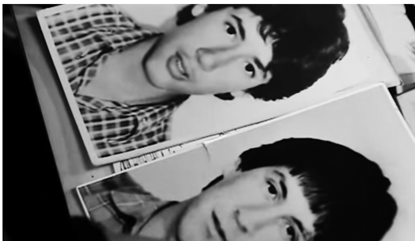
Carmen Castillo, Rue Santa Fe (2007), Les Films d'ici.

ningún alarde. Estos grupos de activistas del presente toman la tradición y la memoria de los vencidos porque encuentran ahí una fuente de dignidad, abandonando así cualquier retórica de heroísmo” (Bensaïd: 3). 25