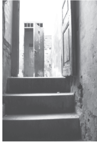
Figura 6: la prisión del D2