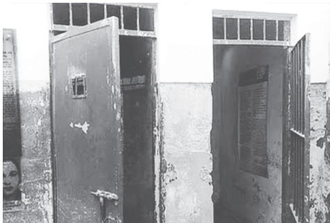
Figuras 7 y 8: hoy, Archivo Provincial de la Memoria