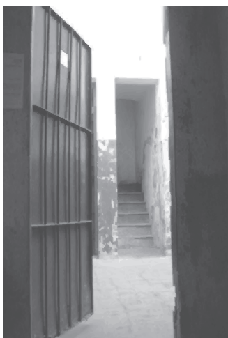
Figuras 4 y 5: la prisión del D2