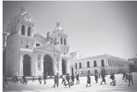
Figuras 1 y 2: en el lateral del Cabildo de Córdoba: lo que fue prisión del D2

Lugar de una visibilidad en exceso, las palabras actuales elaboradas por el Archivo Provincial de la Memoria explican que las paredes de este antiguo Centro Clandestino de Detención aún conservan las marcas del horror. Grafiti en el interior de dos celdas, intactas, son la memoria presente de los que por allí pasaron.