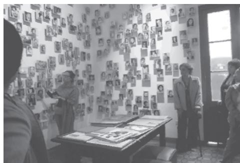
Figura 9: actividad en la Semana de la Memoria en Córdoba (2013)