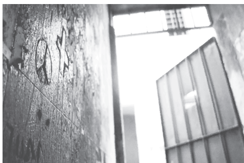
Figura 3: grafitis del D2

no desechado ni vaciado, sino delimitado a un sentido que se privilegia sobre él: el de un sujeto y su historia.